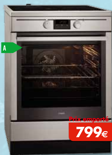
Table de cuisson à induction Four multifonction à air pulsé Volume du four: 72 l Réglage précis par simple pression d'un doigt Hauteur adaptable - Consommation d'un cycle conv.: 0,95 kWh Dimensions (HxLxP) en mm: 850x596x600