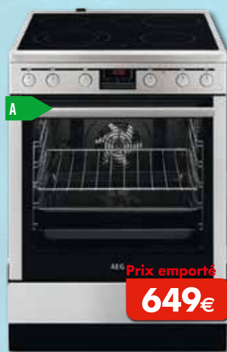
Table de cuisson vitrocéramique Four multifonction à air pulsé Volume du four: 72 l Résultats professionnels grâce à une zone multirécipients Hauteur adaptable - Consommation d'un cycle conv.: 0,95 kWh Dimensions (HxLxP) en mm: 850x596x600