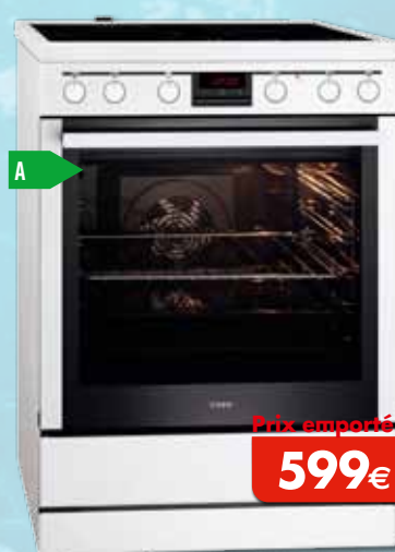
Table de cuisson vitrocéramique Four multifonction à air pulsé Volume du four: 72 l Résultats professionnels grâce à une zone multirécipients Hauteur adaptable - Consommation d'un cycle conv.: 0,95 kWh Dimensions (HxLxP) en mm: 850x596x600