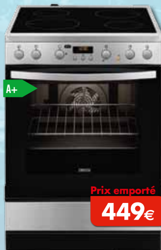
Table de cuisson vitrocéramique Four à air brassé multifonction Volume du four: 72 l - Fonction minuteur - Hauteur adaptable Consommation d'un cycle conv.: 0,95 kWh Dimensions (HxLxP) en mm: 850x596x600